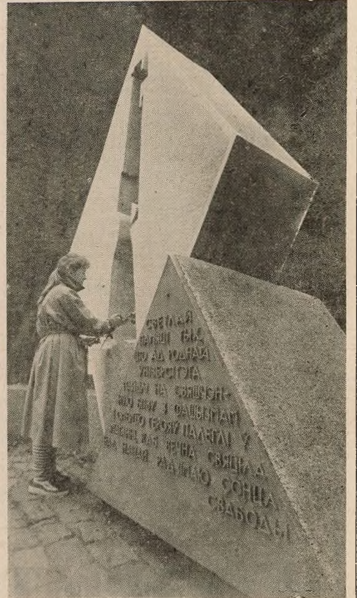
СЁННЯШНЯ ПАКАЛЕННІ студэнтаў і выкладчыкаў заўсёды верныя памяці тых, хто ад сцен роднага ўніверсітэта пайшоў на бітву з фашызмам і аддаў жыццё дзеля свабоды Радзімы. Штодня палымнеюць свежыя кветкі ля абеліска загінуўшым. Універсітэт памятае сваіх герояў.